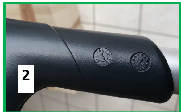
Beispiel: nicht zurückgerufene Produkte 2 Produktionsdaten