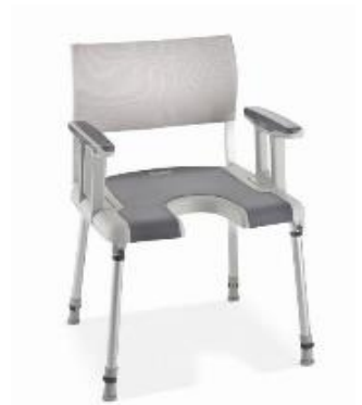
Neues Design (nach Juni 2016)